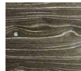
Line | design ENAIP