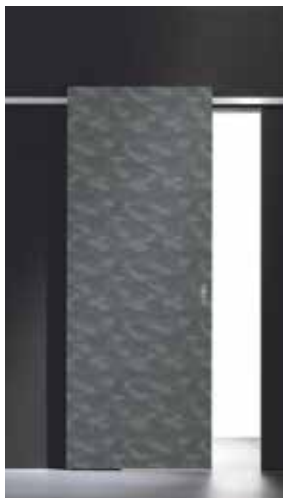
Easy | TRE-P&TRE-Più Lab design Texture Camouflage Meregalli Merlo Architetti Associati