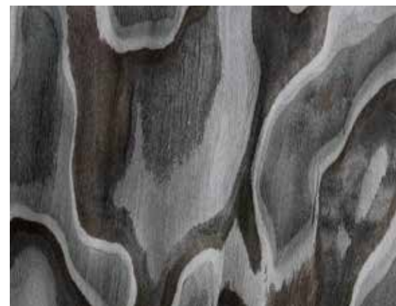
Camouflage | design Meregalli Merlo Architetti Associati