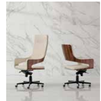
Applications | Reconstituted Veneers | Busnelli International - | 4 Mariani