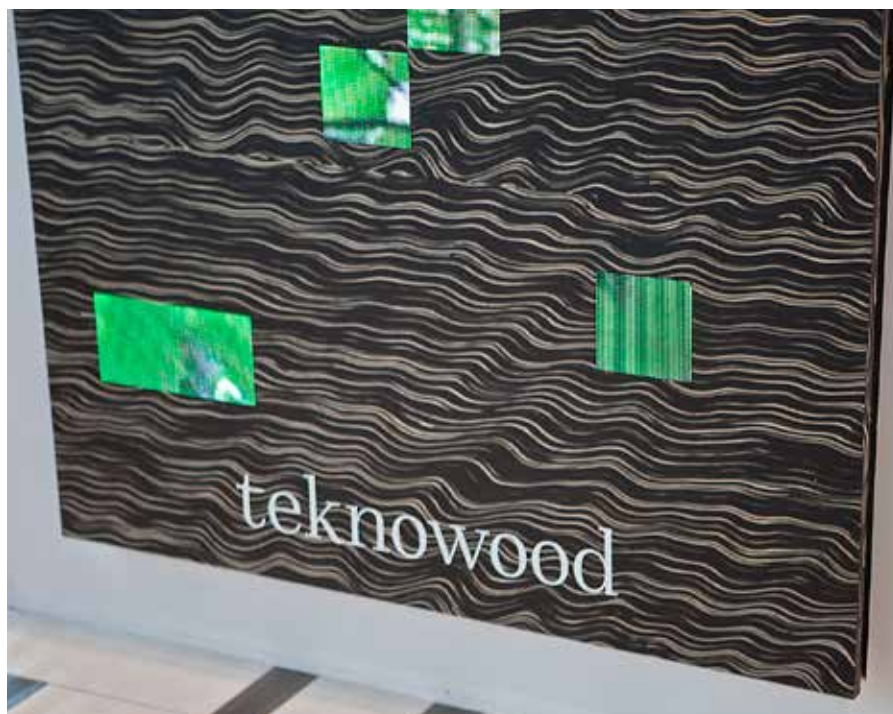
Teknowood | Busnelli International

Thanks to its technological systems and applications, Teknowood offers several opportunities: TV watching, web connection and email, hotel reception services, everything also available with voice control.