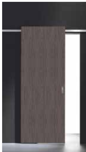
Easy | TRE-P&TRE-Più Lab design Texture Line ENAIP - Istituto di Formazione