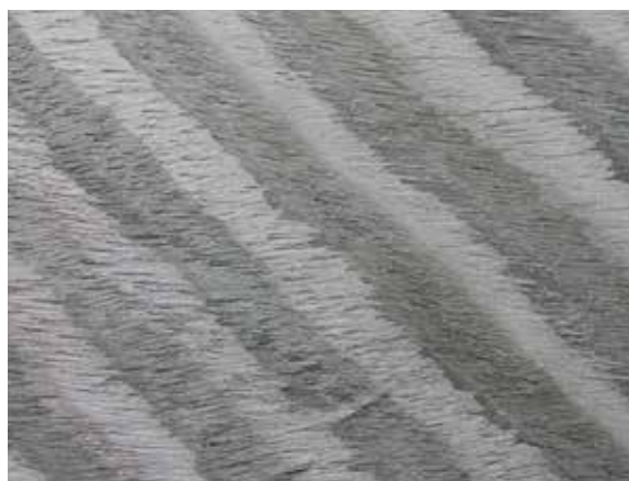
New Type | Reconstituted Veneers