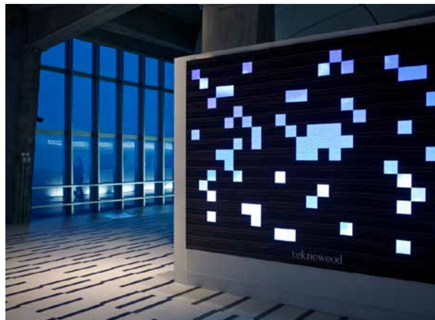
Teknowood | Busnelli International