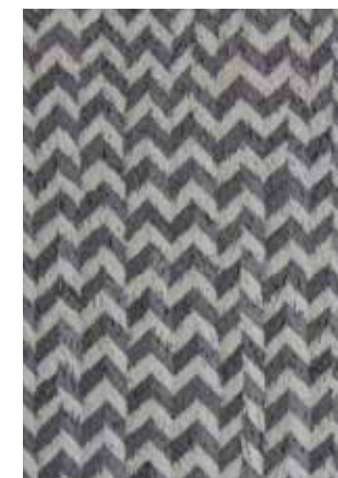
Peak | design Luca De Nova