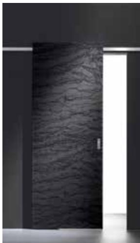
Easy | TRE-P&TRE-Più Lab design Texture Cortex Alessia Galimberti