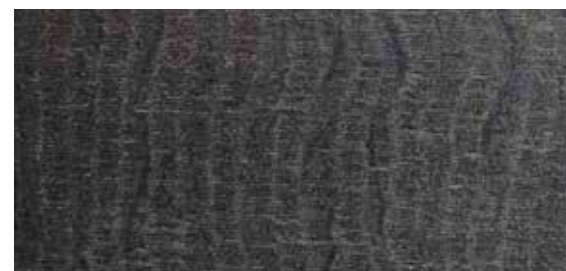
Cortex | design Alessia Galimberti